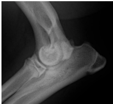
Pero de 2 años con displasia del codo

La displasia de codo es un término que abarca múltiples anomalías del desarrollo de la articulación cubital, incluyendo incongruencia del codo, fragmentación del proceso coronoide medial, no unión del proceso anconeal, osteocondrosis del cóndilo humeral y no unión del epicóndilo medial. Colectivamente, estas lesiones son una causa común de cojera del miembro torácico en perros juveniles de raza mediana y grande. Sin embargo, los mecanismos precisos por los cuales surgen estas anomalías son aún desconocidos.